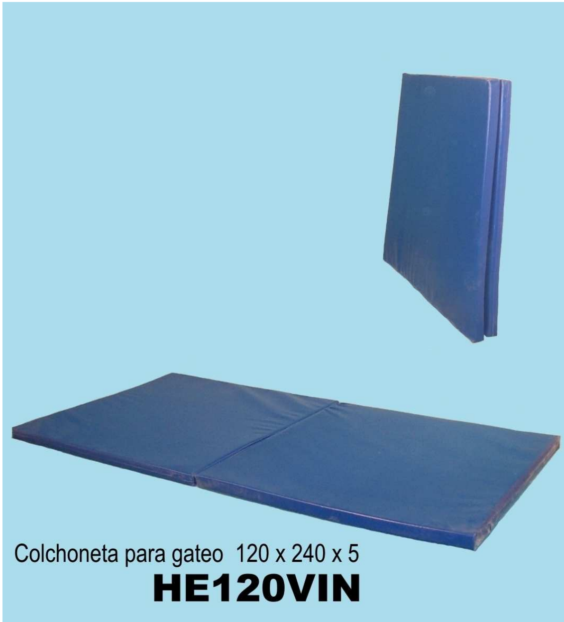
Colchoneta para gateo 120 x 240 x 5 HE120VIN

Edison Nte. 3215 Fracc. Industrial 64440, Monterrey, N.L. Tels. y Fax (81) 8331-6400, (800) 700-TUIN E-mail: tuin@tuin.com.mx www.tuin.com.mx