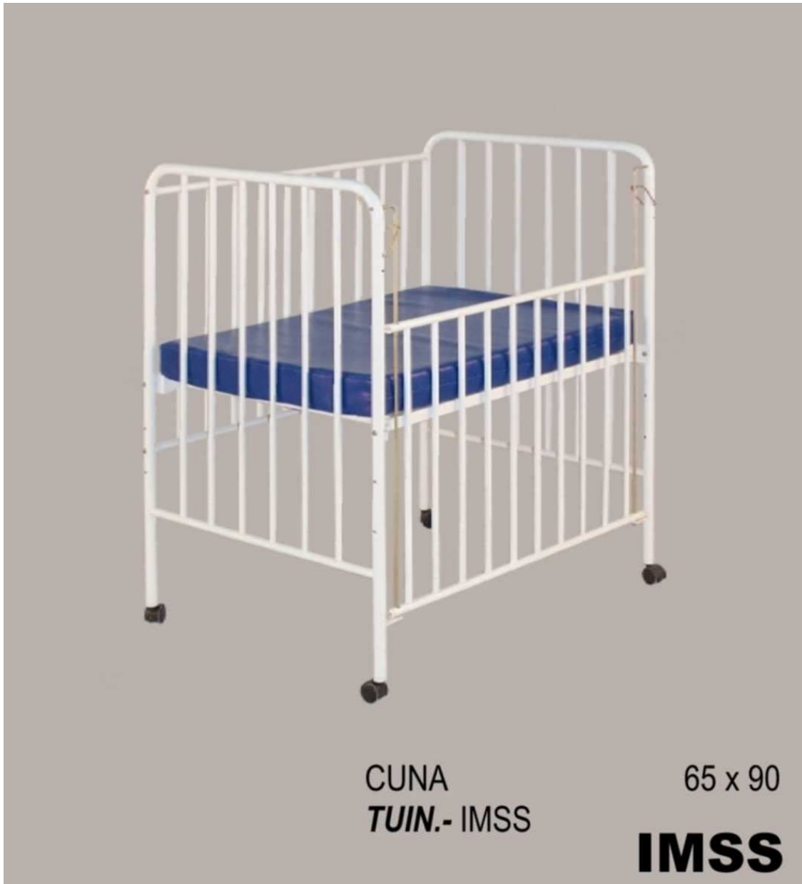
CUNA TUIN.- IMSS

Edison Nte. 3215 Fracc. Industrial 64440, Monterrey, N.L. Tels. y Fax (81) 8331-6400, (800) 700-TUIN E-mail: tuin@tuin.com.mx www.tuin.com.mx